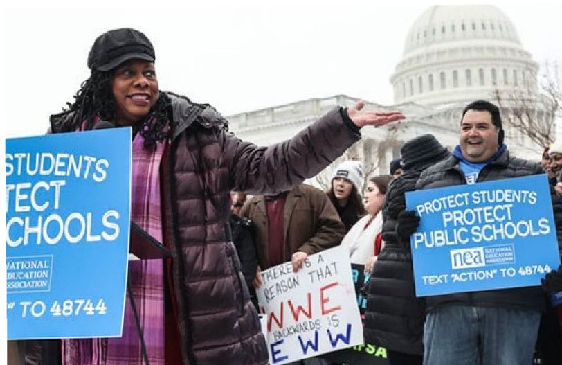
Orador: Presidenta de la NEA, Becky Pringle